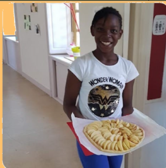
Accompagnement personnalisé de jeunes en décrochage à "l'Escale de Landerneau - FRANCE