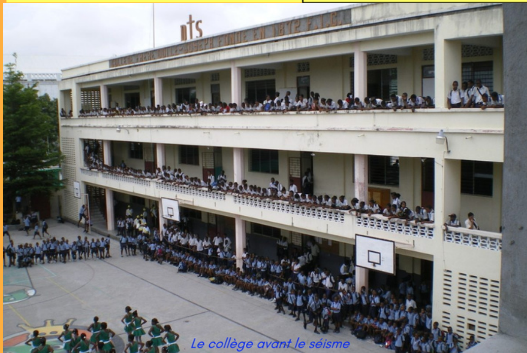
Collégiens de l'école "Frère Odile Joseph" aux CAYES en HAÏTI