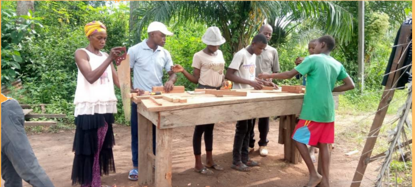
Elèves au centre de formation professionnelle de DUNGU en République Démocratique du CONGO