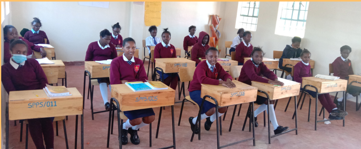
Il n'y a que des filles à l'école St Padre Pio de Timau au Kenya