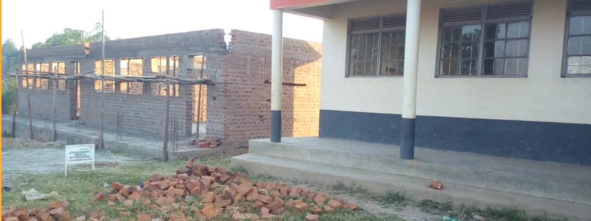
Suite de la construction de l'école de Rwebikwati à Kamwenge en OUGANDA

Système de collecte d'eau de pluie à "La Mennais secondary school" à Kyotera en OUGANDA