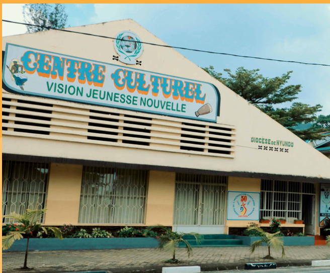
Apprentis en mécanique automobile au centre de formation professionnelle de "Vision Jeunesse Nouvelle" à Gisenyi au RWANDA