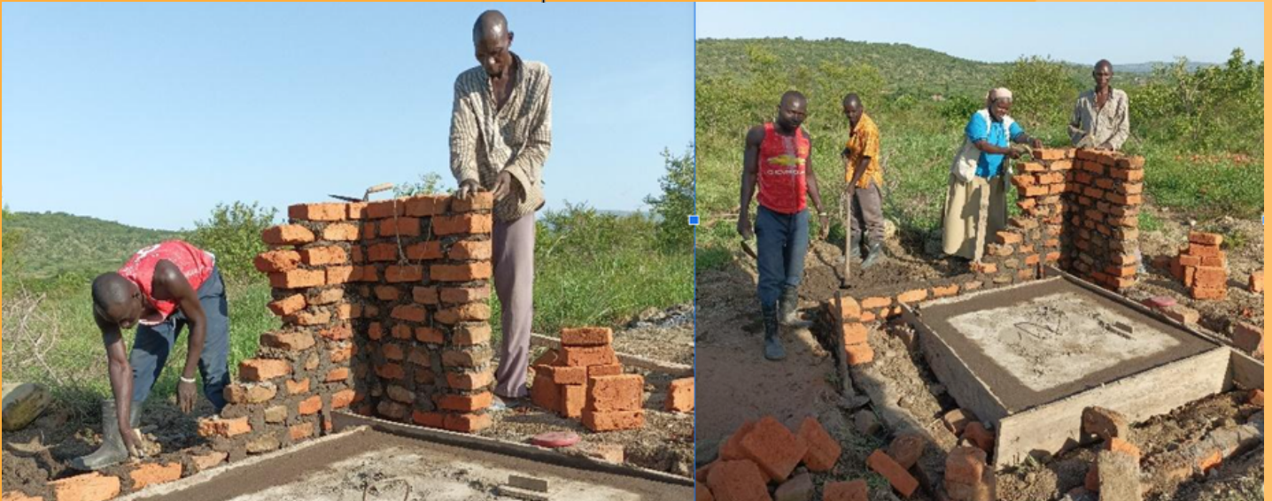
Apprentissage ) l'institut technique St Padre PIO de Buikwe en OUGANDA