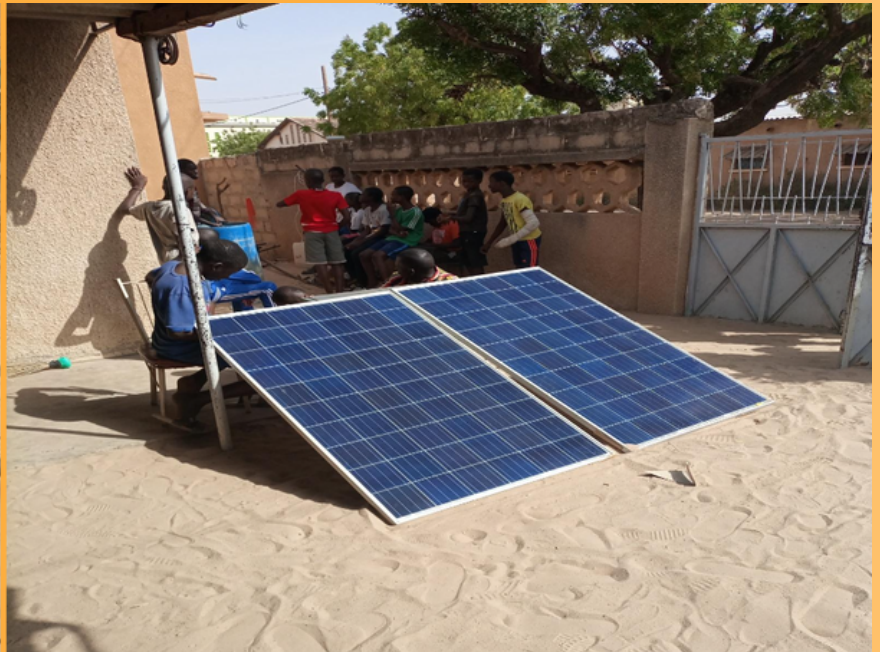
Forage avec pompage solaire au collège Paul VI de Diourbel au SENEGAL