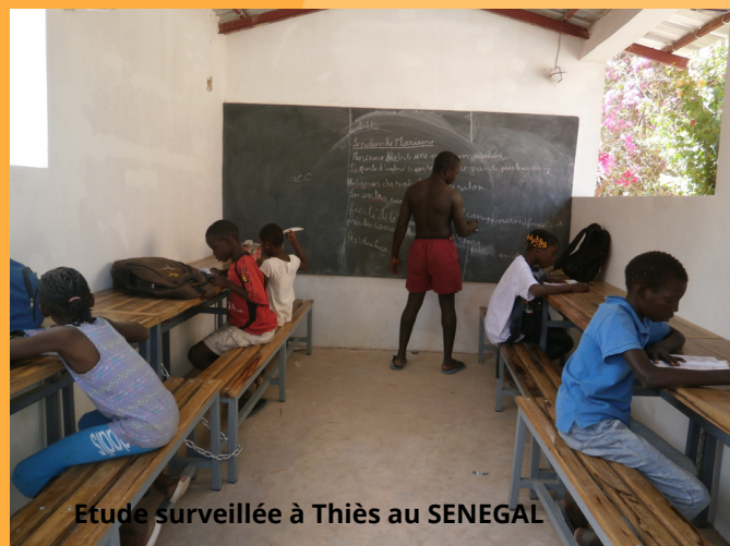
Etude surveillée à Thiès au SENEGAL