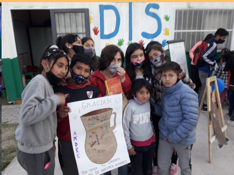
Enfants du quartier reçus à l'association Mennaisienne de Lujan de Cuyo - ARGENTINE