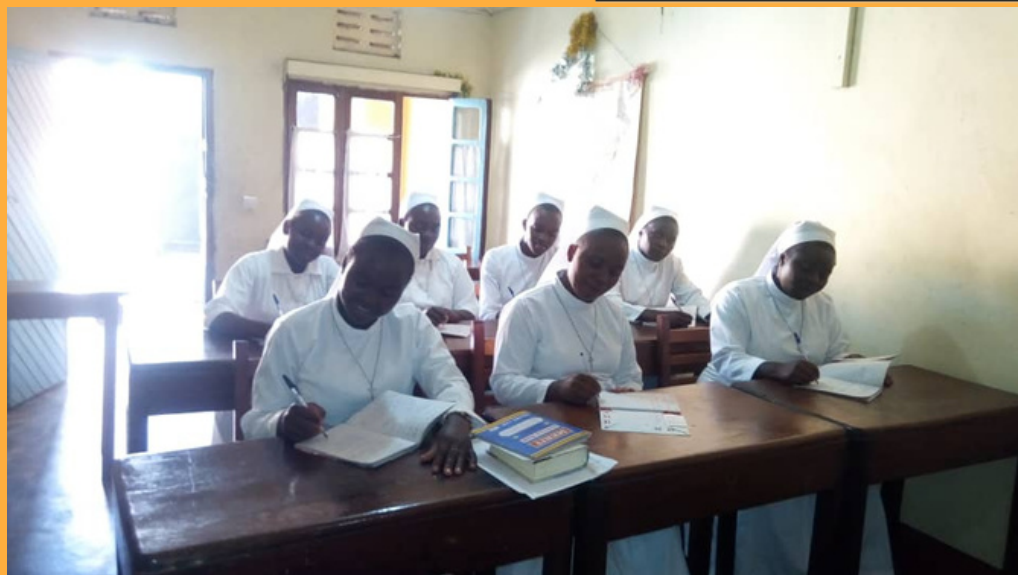
Novices en formation au noviciat de la congrégation des Sœurs de la Charité Maternelle à Bunia en RDC

Matériel de premier secours pour l'école TTC Jean de la Mennais à Kirambo au RWANDA