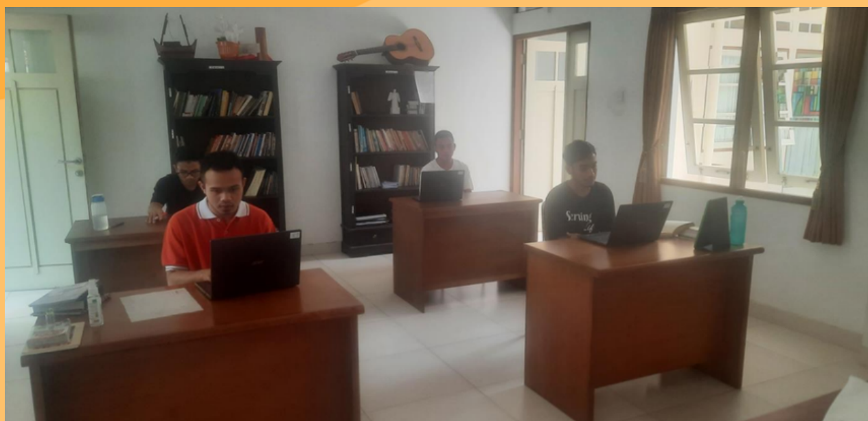
Etudiants bénéficiaires des ordinateurs à Yogyakarta en INDONESIE