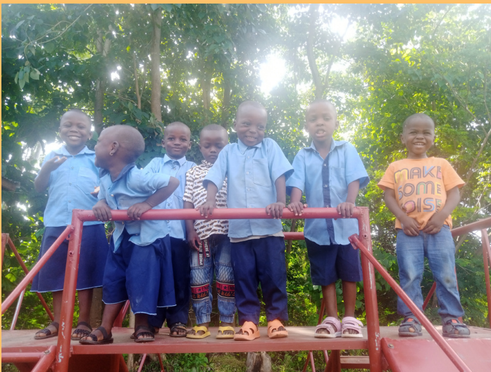
Equipent de la classe et de l'école de Thian au BENIN